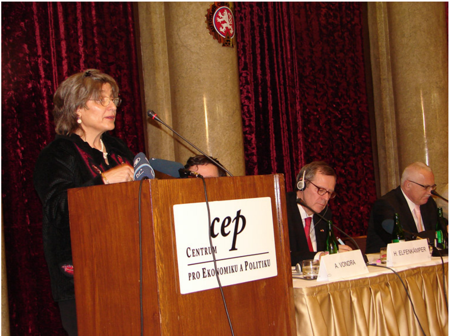
Na přednášce Centra pro ekonomiku a politiku naslouchal Evě Hahnové i Václav Klaus (zcela vpravo).

Zatřetí považuji za závažný rozdíl v Česku tolerovanou vulgárnost jazyka ve veřejném prostoru. To se mi zdá zcela ojedinělým jevem, alespoň ve srovnání s německy mluvícím a anglofonním prostředím. Vulgarita jazyka totiž vede i k vulgaritě myšlenkové, a tedy k povrchnosti, zjednodušování a demagogii.