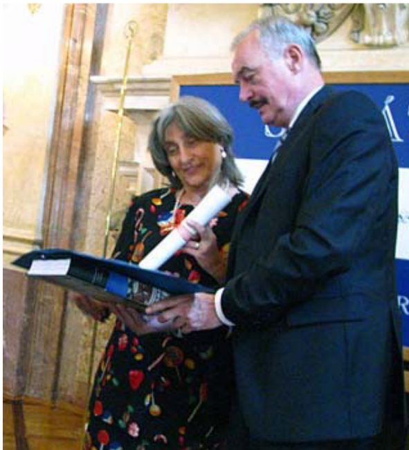
V českém Parlamentu se senátorem Přemyslem Sobotkou

Pojmu „nesporný hegemon Evropy“ bych neužívala, protože je emocionálně předpojatý. Velikost a současná prosperita Německa nejsou žádným požehnáním vyvoleného národa. Právě to si Němci vzhledem ke svým historickým zkušenostem uvědomují lépe než mnohé jiné velmoci.